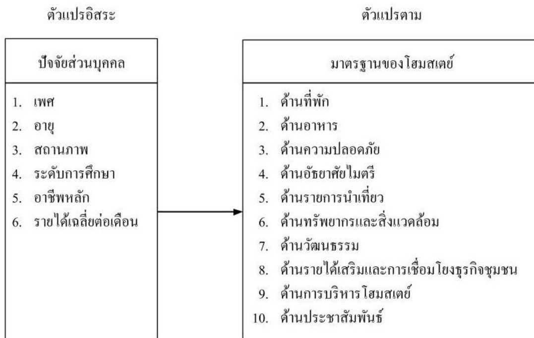
ภาพที่ 2 ความสัมพันธ์ของตัวแปรตามสมมติฐานที่ 2

นักท่องเที่ยวชาวไทยที่มีปัจจัยส่วนบุคคลต่างกัน มีความคิดเห็นเกี่ยวกับมาตรฐาน โฮมสเตย์ริมฝั่งแม่น้ำแม่กลอง จังหวัดสมุทรสงคราม แตกต่างกัน