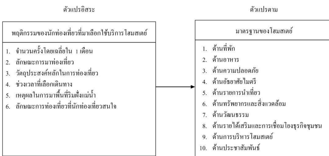
ภาพที่ 3 ความสัมพันธ์ของตัวแปรตามสมมติฐานที่ 3

นักท่องเที่ยวชาวไทยที่มีพฤติกรรมท่องเที่ยวแตกต่างกัน มีความคิดเห็นเกี่ยวกับมาตรฐาน โฮมสเตย์ริมฝั่งแม่น้ำแม่กลอง จังหวัดสมุทรสงคราม แตกต่างกัน